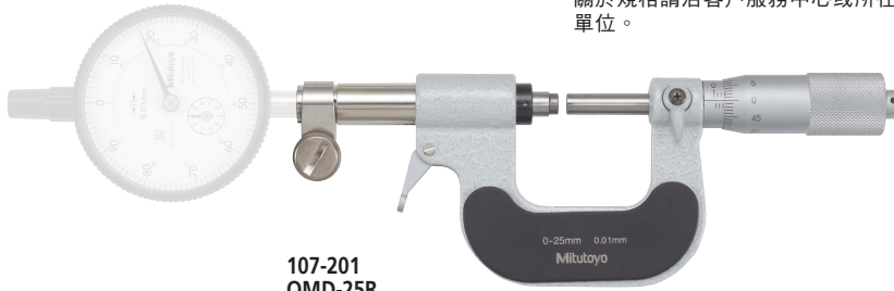
107-201 OMD-25R (指示器為選購品)

※：軸桿徑雖僅限為 \phi 8 ，但有部份機種無法安裝，關於規格請洽客戶服務中心或所在地附近的營業單位。