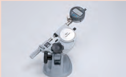
ABS數位式指示量錶安裝例