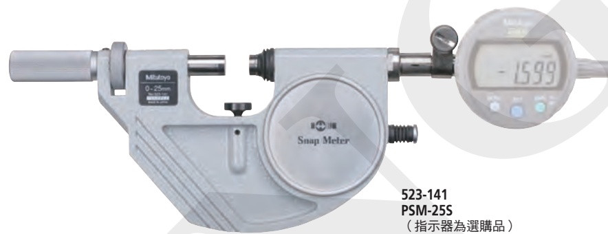
523-141 PSM-25S (指示器為選購品)