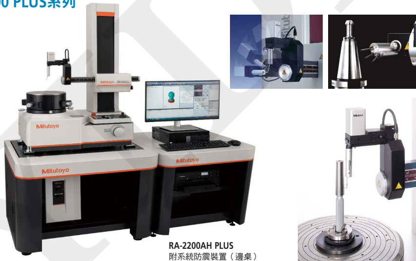
RA-2200AH PLUS 附系統防震裝置 (邊桌)